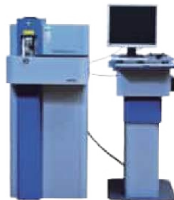
화학 성분 시험기